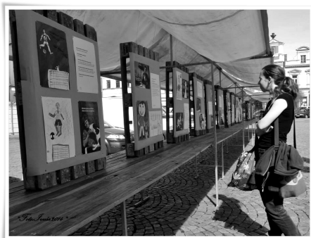
Výstava na Resslerově náměstí

Více o chrudimské části Jednoho světa 2014 se dočtete také v Novinkách na našem webu.